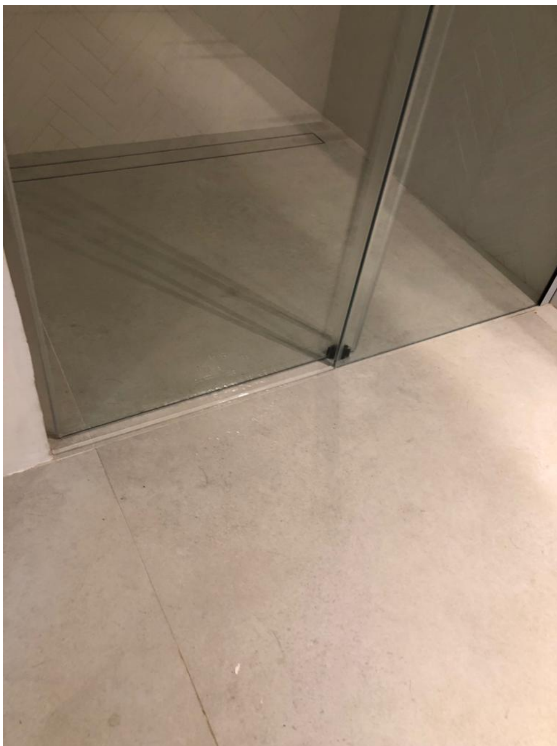
STOPER UMIEJSCOWIONY NA PODŁODZE