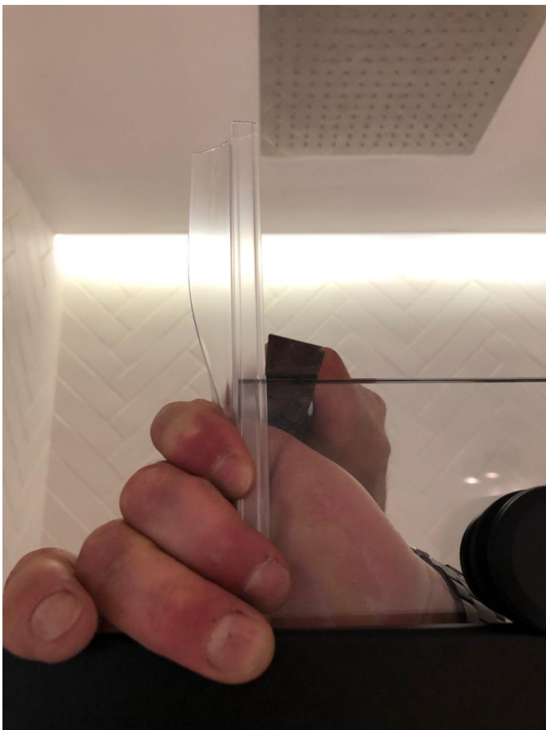
USZCZELKI DOCIĄĆ OD GÓRY DRZWI