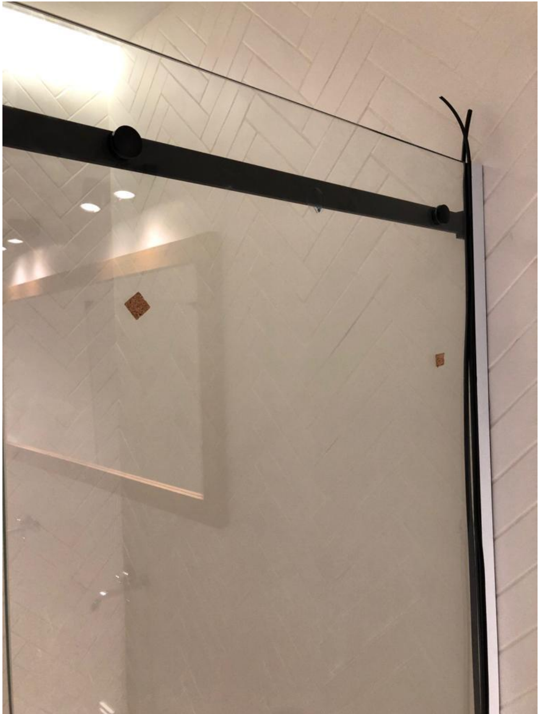
PRZYMOCOWANIE PROWADNICY ŚRUBAMI DO SZYBY.